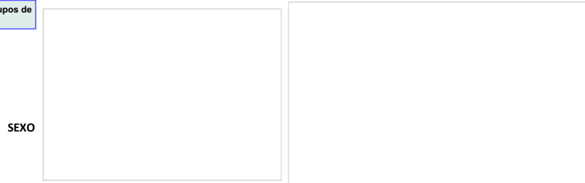
Casos de A300-A309 Lepra multibacilar y A300-A309 Lepra paucibacilar, por condición final y tipo SE 01-52 Ecuador 2024